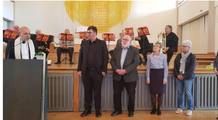
Der eingesetzte BAKS Esslingen

Im Kirchenbezirk Esslingen haben wir am 29. März 2019 mit einem schönen Festakt den dortigen BAKS gegründet.