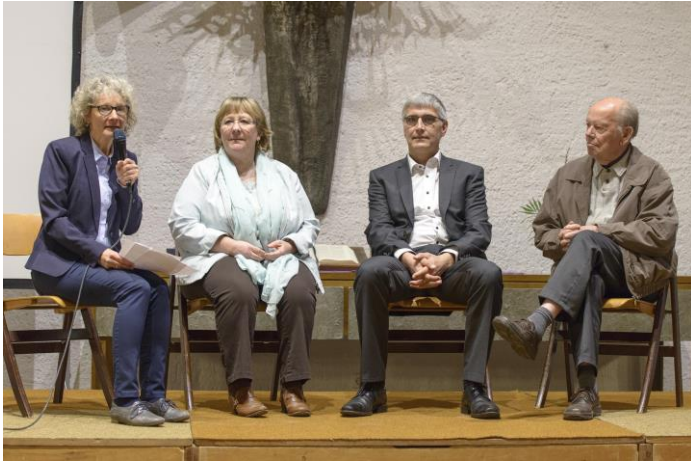
Interview während des BAKS-Jubiläums

Im Kirchenbezirk Esslingen haben wir am 29. März 2019 mit einem schönen Festakt den dortigen BAKS gegründet.